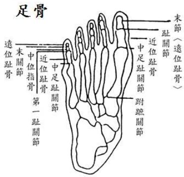
上、下肢關節名稱說明圖